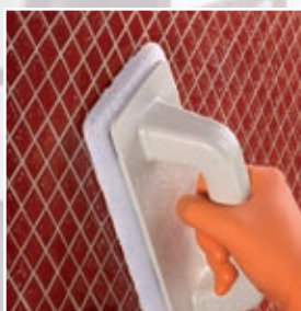
Čištění skleněné mozaiky pomocí Scotch Brite®