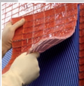
Lepení skleněného obkladu z mozaiky s použitím Kerapoxy Design