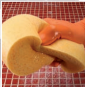
Navlhčení zaspávaného povrchu před jeho dočištěním