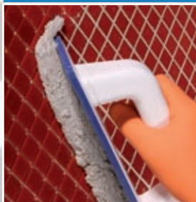
Nanášení Kerapoxy Design