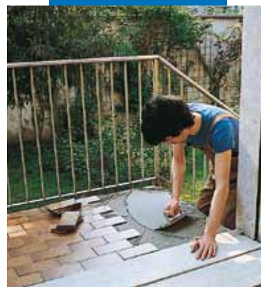
Hydroizolační stěrka a následné lepení dlažby s použitím Kerabond T + Isolastic