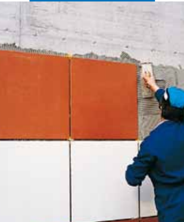
Lepení velkoformátových obkladů - Kerabond T + Isolastic

Sádkové podklady a anhydridové potěry musí být dokonale suché (maximální zbytková vlhkost 0,5%, u podlahového topení 0,3%), dostatečně pevné, obroušené a důsledně zbavené prachu. Vždy musí být ošetřené Primerem G nebo Eco Primerem T . Plochy vystavené zvýšené vlhkosti prostředí musí být ošetřené Primerem S .