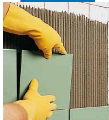
Lepení obkladu na starý obklad