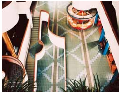
Lepení glazovaného gressu - Kerabond+Isolastic - Občanské centrum - North York Ontario (Kanada)

Isolastic není podle aktuálně platných norem týkajících se zařazení směsí považován za nebezpečnou látku. Doporučuje se používat ochranné rukavice a brýle a dodržovat opatření jako při běžné manipulaci s chemickými výrobky.