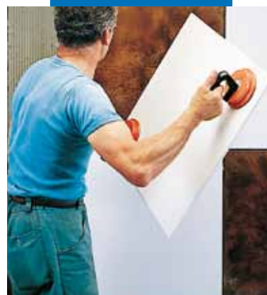
Lepení obkladu Keraion na stěny