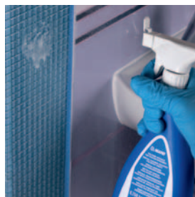
Čištění povrchu obkladového prvku po spárování