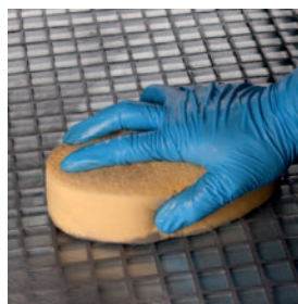
Konečné umývání houbou